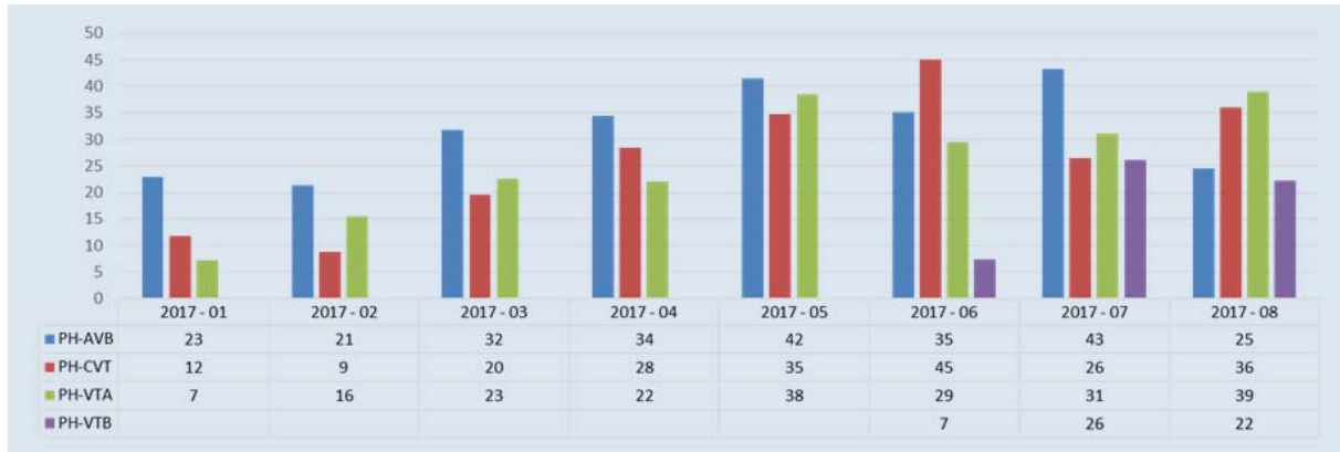
De gevlogen uren in 2017 t/m augustus 2017